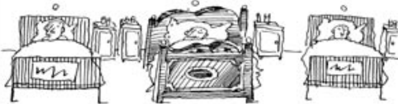
Egészségügy hozott anyagból

hogy az államnak finanszírozási problémái lehetnek, mert a bevételek nem olyan rendszerességgel jönnek, mint ahogy az állami támogatást az önkormányzatok kapják. . . egyszer szembe kell néznünk azzal a ténnyel, hogy meg kell fizetnünk azokat a bizonyos évtizedeket és gazdasági következményeit, amely az elmúlt éveket jellemezte. . .