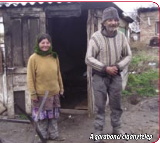
A garabonci cigánytelep

Az ott élők lakásai fából, bádogból összeállított „építmények”. A telepre kövezett út nem vezet, rossz időben megközelíthetetlen, amely jelentősen gátolja az ott élőket a szociális ellátórendszer igénybevételében. A közművek hiánya miatt jelentős a fertőzésveszély.