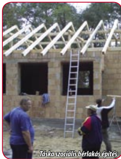
Táskaszociális bérlakás építés

b. A szegregálódott, infrastruktúra nélküli városi lakótelepek, településrészek rehabilitációja; az ott élők foglalkoztatási és szociális integrációjának elősegítése. (ROP-ok, keretösszeg: 10,7 Mrd Ft)