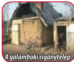
A galamboki cigánytelep

sen 24 fő, köztük 13 gyermek élt, lakásnak nem minősíthető épületekben. Az egyik telepen semmilyen közmű nem volt bevezetve, a másikon is csak villany. Az ivóvízet kútról hordták, tisztálkodásuk nem volt megoldott.