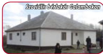
Szociális bérlakás Galambokon

A település a program keretében 64 713 000 forint támogatásban részesült. Ennek köszönhetően mind a hat család lakhatása megol-