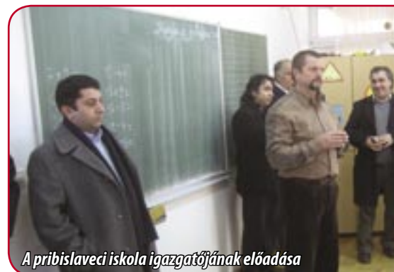
A pribislaveci iskola igazgatójának előadása

A szociális alprogram keretében foglalkoztatási, képzési programok indítását; a szociális ellátások igény-