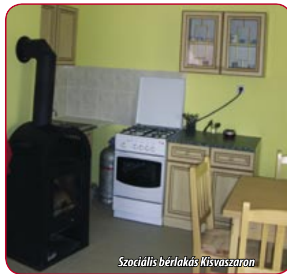
Szociális bérlakás Kisvaszaron

Magyarországon megközelítőleg százezer ember él, közel 500 telepen, teleszerű lakókörnyezetben, amelyek jelentős számban kistelepülésen vagy azok közigazgatási határain kívül találhatók. A telepek, teleszerű lakókörnyezetek felszámolása – a telep típusának, nagyságának, kistérségi, regionális elhelyezkedésének, stb. függvényében – sokféle, más-más fajtájú beavatkozási lehetőséget kíván meg. Más típusú eszközökkel kell segíteni, elérni az Alsószentmártonban, a nyíregyházi Guszevtelepen és a szomolyai pincelakásokban élő családok integrációját. Az Új Magyarország Fejlesztési Terv Nem mondunk le senkiről zászlóshajó programja a leghátrányosabb helyzetű térségek fejlesztésére irányul. A