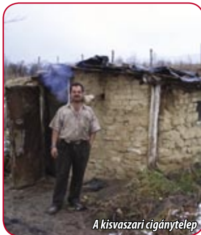
A kisvaszari cigánytelep

Az intézkedési tervben megjelölt feladatokra, a romák és hátrányos helyzetű társadalmi csoportok és a hátrányos helyzetű területeken élők támogatására összesen (hazai költségvetésben és ÚMFT-ben) több 10 milliárd forintnyi forrás áll rendelkezésre. A tervezett feladatok részben normatív ellátásként (pl. ingyenes étkeztetés), részben projektszerűen (pl. tanoda-programok) kerülnek megvalósításra.