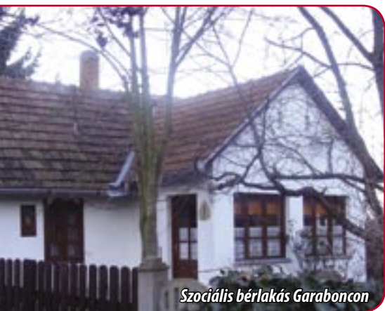
Szociális bérlakás Garaboncon

Az ott élők lakásai fából, bádogból összeállított „építmények”. A telepre kövezett út nem vezet, rossz időben megközelíthetetlen, amely jelentősen gátolja az ott élőket a szociális ellátórendszer igénybevételében. A közművek hiánya miatt jelentős a fertőzésveszély.