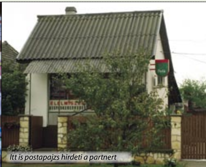
Itt is postapajzs hirdeti a partnert

álláshoz. Úgy éreztem, hogy van még felesleges energiám, tehát belevágtunk a partnerségi programba. Nem csalódtunk. Aki bejön egy csekket vagy levelet feladni, az általában vesz még valamit, kekszet, kenyeret, cukrot.