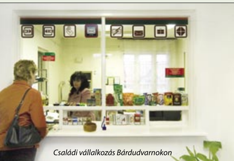
Családi vállalkozás Bárdudvarnokon

– Éppen augusztusban volt 17 éve, hogy megnyitottuk ezt a kis boltot. Egyedül szolgálom ki az embereket, de az árubeszerzésbe a férjem is besegít. Helyben is nagy a konkurencia, a városi áruházláncok is igyekeznek elszipkázni a vevőket, ezért igyekszünk mindig új dolgokat kitalálni a több lábón