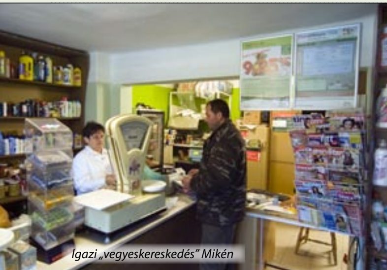
Igazi „vegyeskereskedés” Mikén